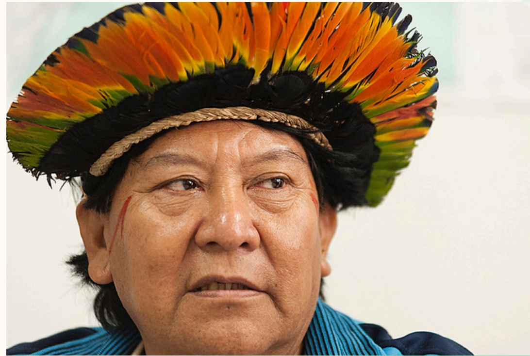
DAVI KOPENAWA : 1956

“Nous continuerons à faire danser, les xapiris (les esprits de la Terre) à faire danser leurs images et à défendre leur maison aussi longtemps que nous serons vivants. Nous sommes des habitants de la forêt. C'est là notre manière d'être et ce sont ces paroles que je veux que je veux faire comprendre aux blancs.”